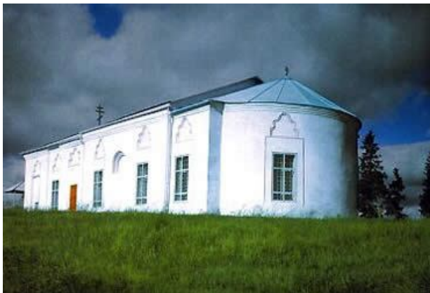
Церковь в честь Рождества Пресвятой Богородицы, построенная в конце XVIII века (1778 г.) на месте сгоревшей деревянной церкви.

Трудно представить будущее народа, у которого нет настоящего, а всё – бывшее. В том числе – и святых.